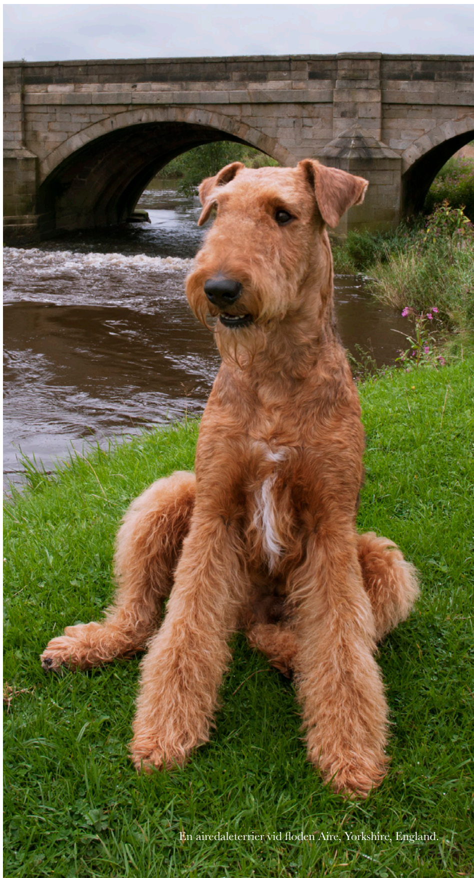
En airedaletterrier vid floden Aire, Yorkshire, England.